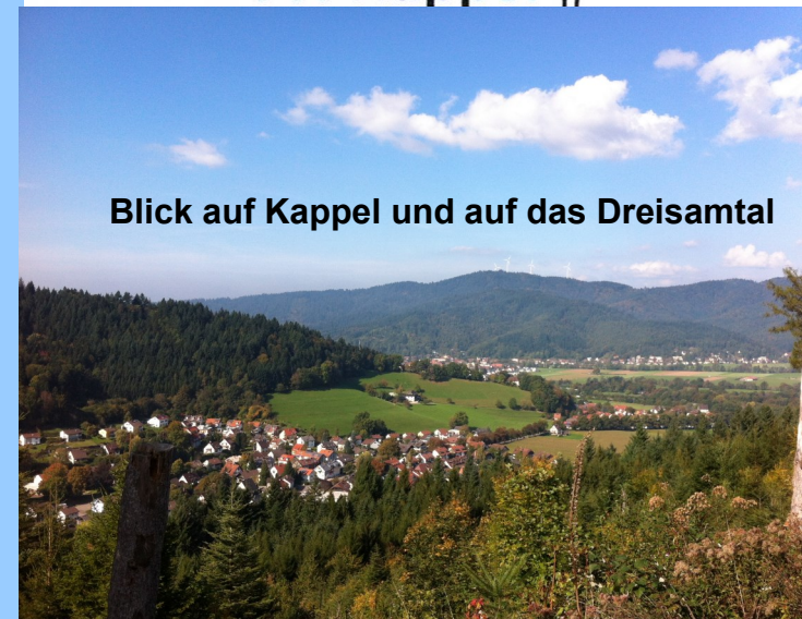
Blick auf Kappel und auf das Dreisamtal