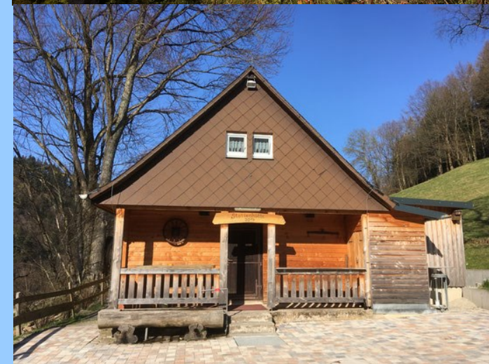
Kontrolle 2 Stollenhütte